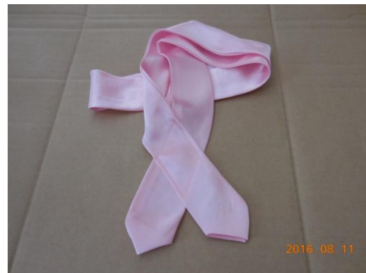
10 タスキ (ピンク色)