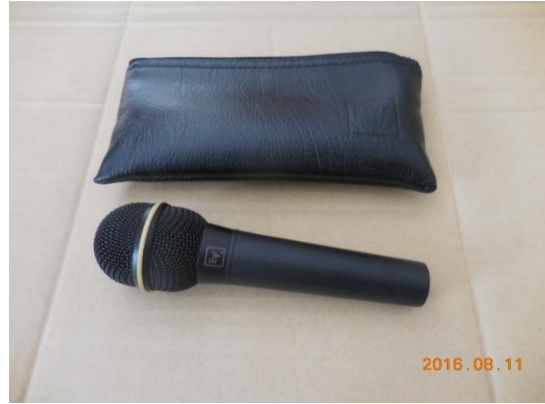
2 マイク (エレクトロボイス N/D767a)