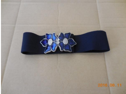
7 ベルト (女性用)