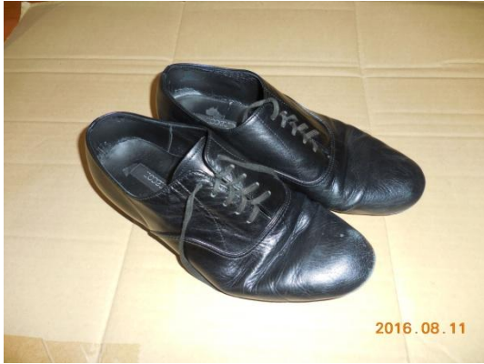
1 ダンスシューズ (チャコット製:男性用)